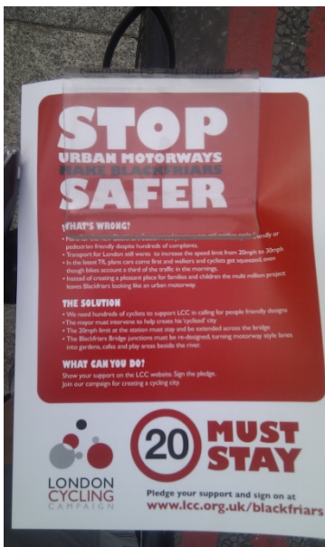
Campaña por reducción de velocidad sobre los puentes, cuando B Johnson propuso aumentar a 48 kph (30 mph). “Keep it 20” fue el lema, y lo logramos! Hoy en día, casi todas las calles de Londres tienen un límite de velocidad de 20mph (32kph).