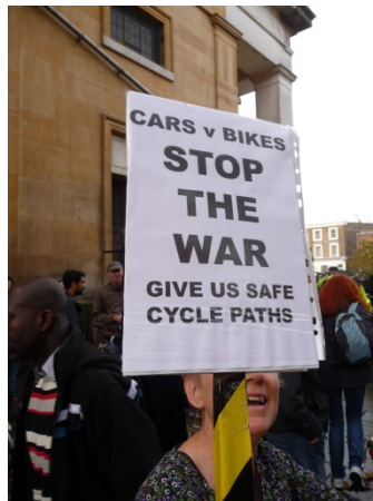
Campaña por ciclovías y cruces seguros, con prioridad para ciclistas.