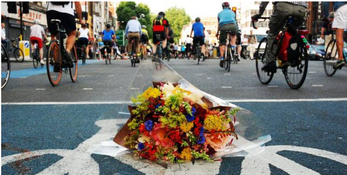
Foto de la manifestación “Blue Paint is not enough, en el Este de Londres, donde murieron los dos ciclistas.

En 2008, Boris Johnson ganó las elecciones y se coronó London Mayor. Y ahí se empezaron a ver grandes cambios. El, bien o mal, andaba en bicicleta para todos lados (ahora ya no), cosa que Ken Livingstone no. Esta vez, su ego exacerbado nos vino de perillas. Si bien el proyecto que vemos hoy en las calles, había sido ideado por el equipo de Ken Livingstone, incluidas las bicicletas de alquiler, quien agarró la posta fue Boris Johnson. Se crearon las Cycle Superhighways, con la intención de conectar Este y Oeste, Norte y Sur. La primera de éstas anchas ciclovías se llamó Cycle Superhighway 3, de este a oeste, abarcando el centro de la ciudad principalmente. Pero las ciclovías no estaban segregadas, y muchos automovilistas las usaban como estacionamiento gratis. Mientras tanto, ciclistas seguían muriendo bajo las ruedas de camiones, llegando a un punto máximo de 21 ciclistas muertos en el 2005. En 2010, cuando ya las Cycle Superhighways se comenzaban a implementar, murieron 15 ciclistas. London Cycling Campaign comenzó su campaña para segregar esas ciclovías pintadas de azul, cuando, en el lapso de una semana, dos ciclistas fueron atropellados cuando pedaleaban en una de esas ciclovías. La campaña, bajo el lema “Blue Paint is not Enough” (pintura azul no es suficiente) contó con varias manifestaciones bajo diferentes lemas, como “Space for Cycling”.