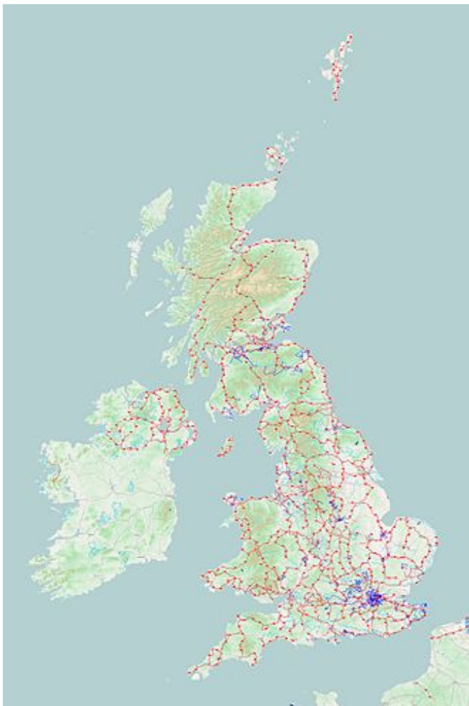
Mapa de la National Cycle Network